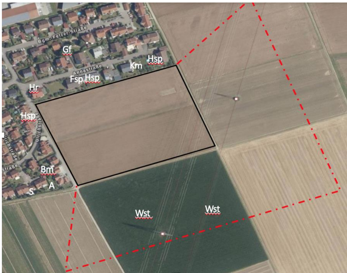
Abbildung 3: Brutnachweise Vögel (Kürzel siehe Tabelle)