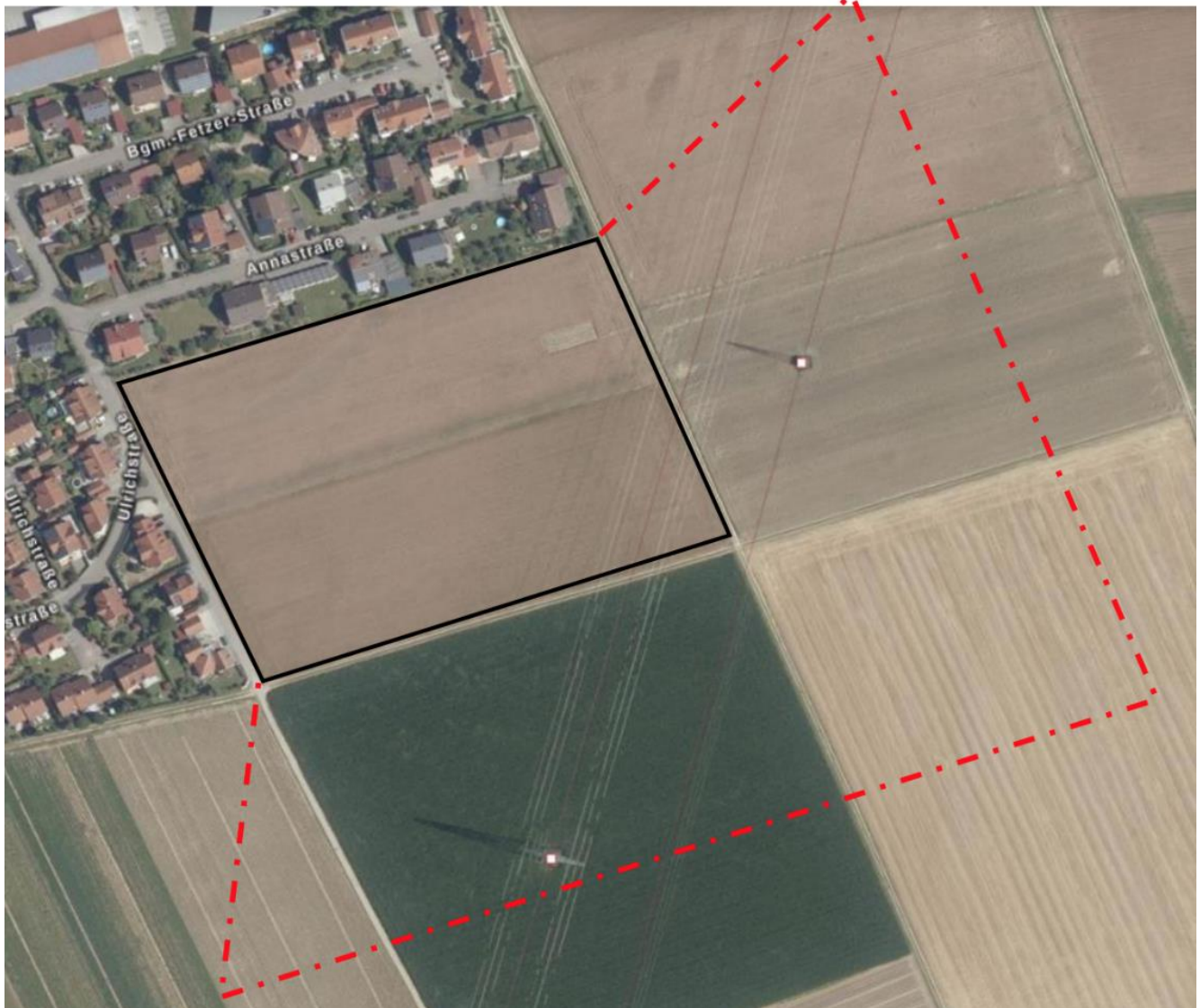
Abb. 1: Lage der Untersuchungsfläche (Rot=Untersuchungsfläche, Schwarz=Vorhabensfläche)

Der Betrachtungsraum der artenschutzrechtlichen Prüfung umfasst das Vorhabensgebiet und den daran angrenzenden Wirkraum von bis zu 100 m (Kulissenwirkung Feldlerche). Die Lage des Untersuchungsgebietes ist aus Abb. 1 ersichtlich.