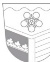
Erich Winkler Erster Bürgermeister