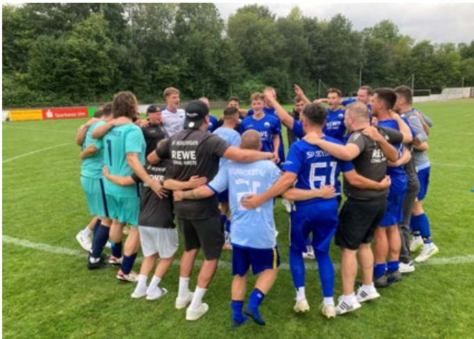
Großer SVN-Jubel nach dem Auswärts-Coup

Das war eine bärenstarke Leistung unseres Teams, wahrscheinlich das beste Spiel des SVN seit längerem: unsere Jungs haben am vergangenen Wochenende der TSG Söflingen die erste Saisonniederlage beigelegt, der SVN hat im Ulmer Westen auch in dieser Höhe verdient mit 4:1 gewonnen!