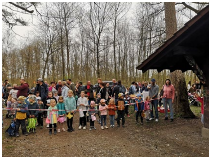
Um genau 15.00 Uhr startet die Suche am Auwald-Spielplatz