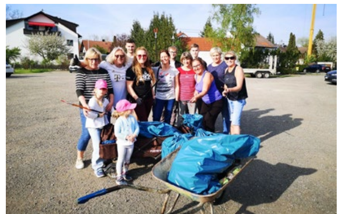
Unsere Helfer und "die Strecke" von der Putzete

Da "kehrt z'sam, was z'sam g'hört!" Zum ersten Mal hat sich unser Verein an der Putzete der Gemeinde Nersingen beteiligt; unsere freiwilligen SVN-Heinzelmännchen (und nicht zu vergessen unsere Heintel-Weibchen) haben sich das Gebiet vom Bahnübergang über den Spielplatz am Waldrand und den Containerstandort sowie den Radweg entlang bis hin zu unseren Vereinsanlagen und dem Sportheim vorgenommen; wir haben in mühevoller Handarbeit das aufgesammelt, was andere achtlos auf den Boden und in die Landschaft werfen. Vielen Dank unserer fleißigen Truppe; es waren mehr als 20 SVN-Mitglieder am Start! Weil so viele geholfen haben, konnten wir uns auch noch den Weg bis zur Kläranlage und das gesamte Gelände am Auwald-Spielplatz vornehmen. Und unsere Fußball-Jungs sind dann sogar noch den Weg durch den ganzen Auwald hintenherum bis zurück zum Sportplatz abgelaufen!