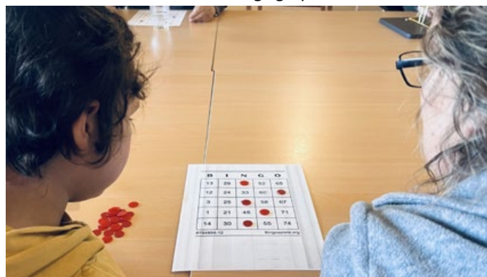
Bingo-Team in Aktion

Anschließend wurde in Teams Bingo gespielt.