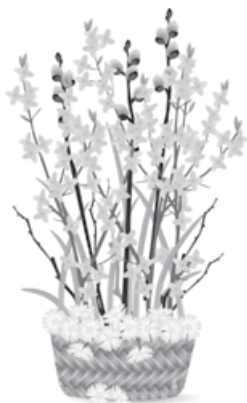
Erich Winkler Erster Bürgermeister

Ich würde freue mich, Sie zur Bürgerversammlung begrüßen zu dürfen.