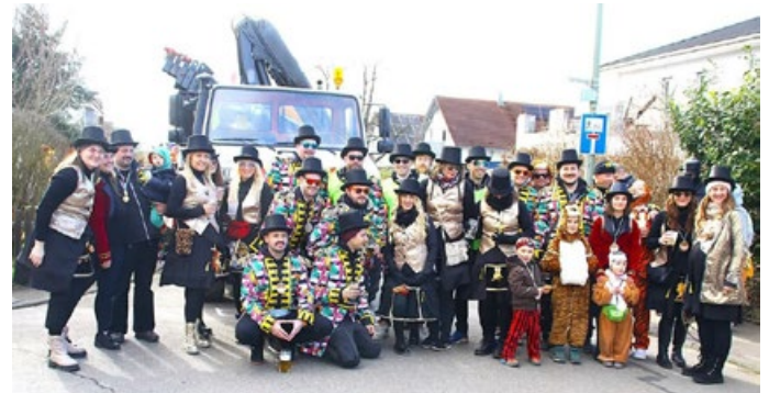
Bixa Öffner TT 2025

Am vergangenen Samstag verwandelte sich Straß erneut in eine Hochburg des närrischen Treibens. Beim traditionellen Faschingsumzug zogen zahlreiche aufwendig gestaltete Wagen und fantasievoll verkleidete Gruppen durch die Straßen und begeisterten die Zuschauer. Unsere Faschingsabteilung "Die Bixa-Öffner" führten den Umzug dieses Jahr nun schon zum 22. Mal an. Mit dieser Schnapszahl wurde ein mehr als würdiges Jubiläum gefeiert!