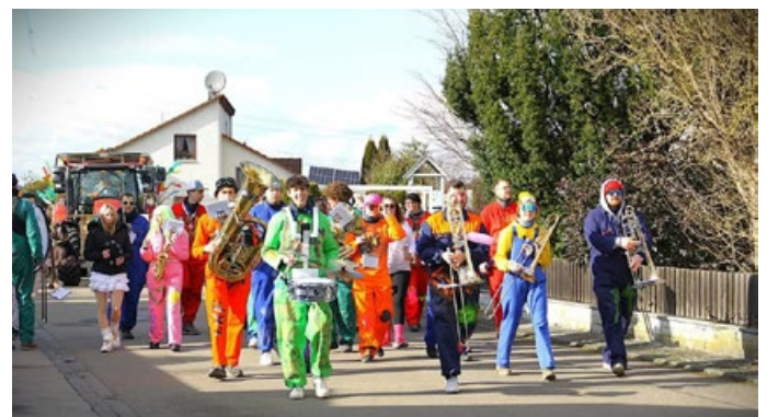
Foto: Lumpen Kapelle Fahlheim in Action

Bei strahlendem Wetter feierten tausende (!) Besucher entlang der Strecke, jubelten den Teilnehmern zu und ließen sich von der ausgelassenen Stimmung mitreißen. Von Zirkusartisten, Wikingern, Sträflingen, Minions, Hexen, Malern, ... bis Jim Knopf – die Vielfalt der Kostüme und Darbietungen ließ keine Wünsche offen.