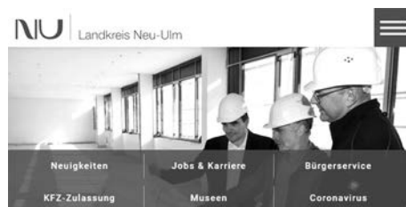
Tablet-Ansicht der Startseite der neuen Website des Landkreises Neu-Ulm.

Wir freuen uns auf Ihren digitalen Besuch!