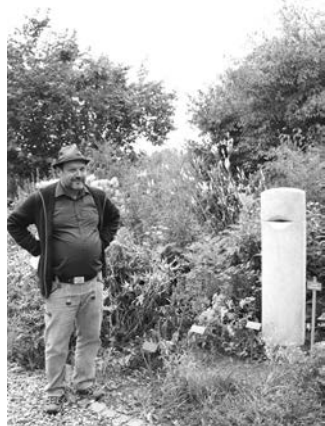
Richard Geczi ist der Schöpfer der Skulptur „Lipstick“. Es ist eines von 16 Kunstwerken, die jetzt als Kunstpfad im Kreismustergarten ausgestellt sind.