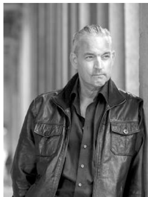
Christian Kahrman, bekannt aus der TV-Serie „Lindenstraße“, kommt nach Illertissen und berichtet über seine Long-Covid-Erkrankung.

Die weiteren Termine im Rahmen der Reihe VITAL.REGIONAL.DIGITAL können der Übersicht im pdf-Anhang entnommen oder unter der Internetadresse www.vhs-neu-ulm.de recherchiert werden. Telefonische Rückfragen unter der Nummer 07303/41200.