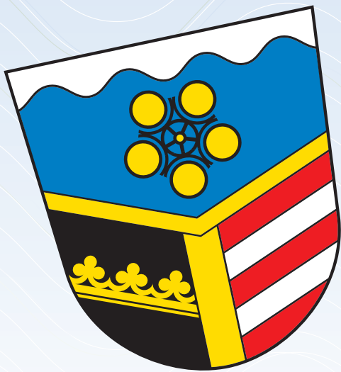
Nersingen / Bayern